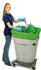
バイオサークル ミニ