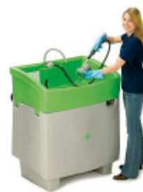
バイオサークル マキシ