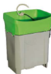
バイオサークル GT コンパクト