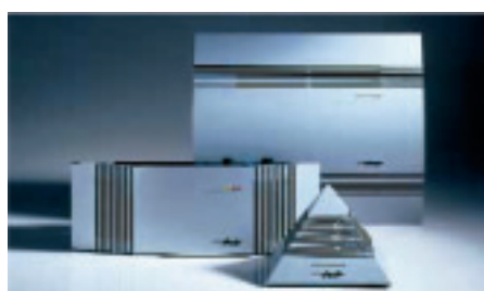
家庭向け 「エアードコ」

・病原菌、ビールス、カビ孢子 ・悪臭の元凶となる溶剤等の揮発性有機物 ・花粉等の空中浮遊微粒子など