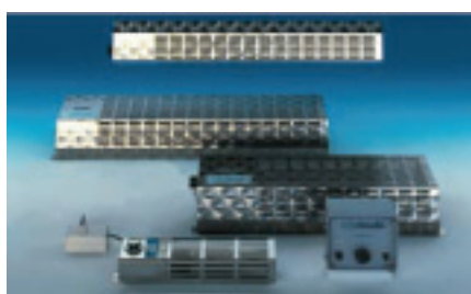
天井取付型 「アエロテック」