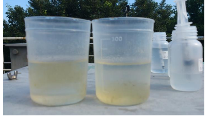
凝集剤 左従来量 右従来量の1/2

マイクロナノバブルが入っているときは、少ない凝集剤で、相対的なカチオンリッチな状態になり、凝集性があがるのが、この実験で確認できました。