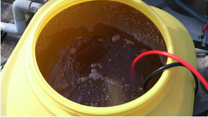
200 リットル ポリタンクに原水を入れ、 マイクロバブルを発生させた状態

薬注量が少なくなることもあり、汚泥も低減できます。この効果は以下の例をご参照ください。